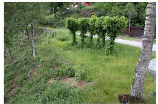
JA- PARKEN MOT VEST