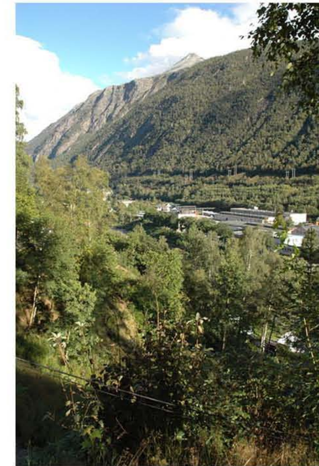
UTSIKT MOT ØST