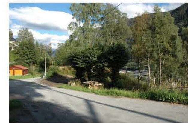
VILLAVEIEN OG JA- PARKEN MOT SØR