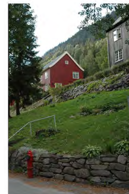
STØTTEMUR NR. 42