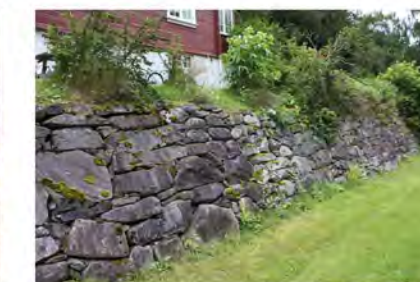
STØTTEMUR NR. 35