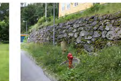
STØTTEMUR NR. 39