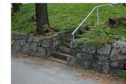
STØTTEMUR NR. 33