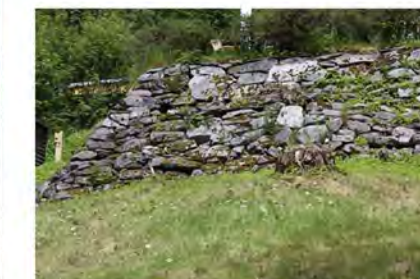
STØTTEMUR NR. 40