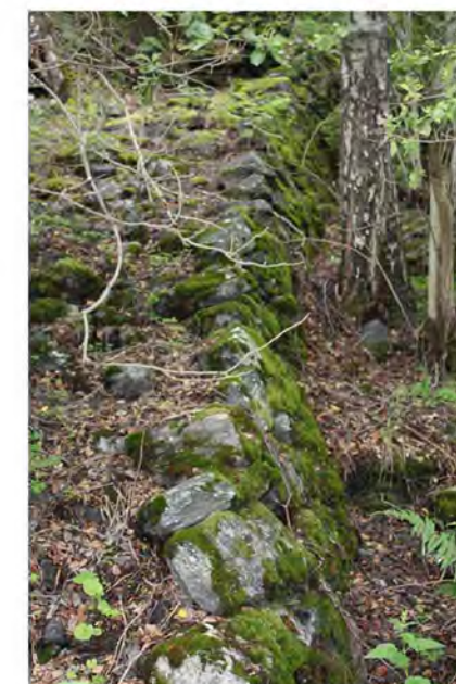
STØTTEMUR NR. 31

Støttemur langs Fjellveien nr. 1, 3 og 5. Muren danner et sammenhengende plan for de tre tomtene. Materiale: Naturstein. Store blokker. Utførelse: Blokkene er tørmurt i forbandt.