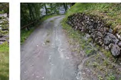
STØTTEMUR NR. 38