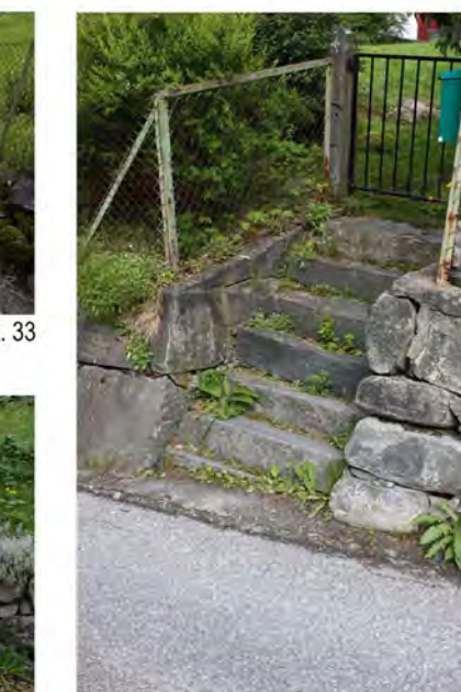
STØTTEMUR NR. 33