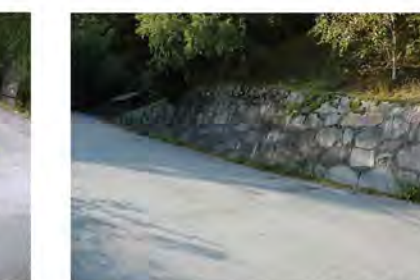
STØTTEMUR NR. 36