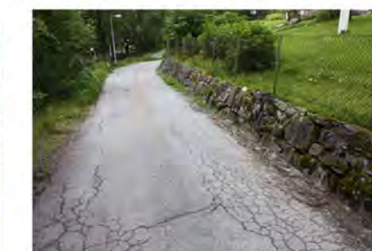
STØTTEMUR NR. 33