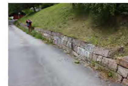
STØTTEMUR NR. 34