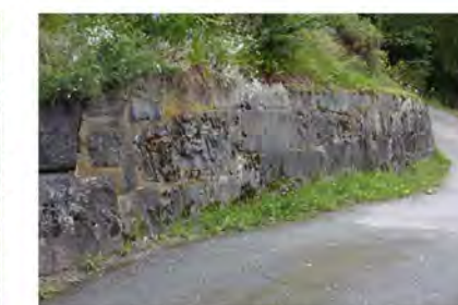
STØTTEMUR NR. 37