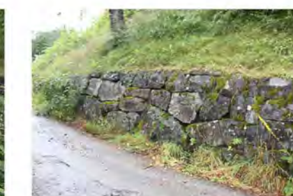
STØTTEMUR NR. 18