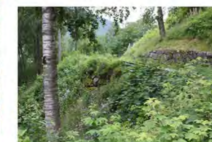
STØTTEMUR NR. 20