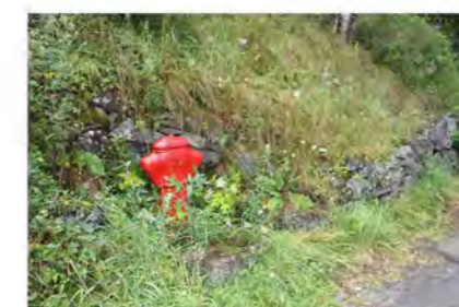
STØTTEMUR NR. 19