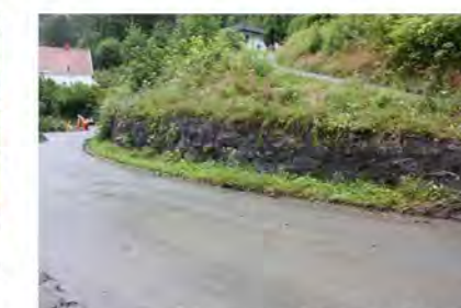
STØTTEMUR NR. 21