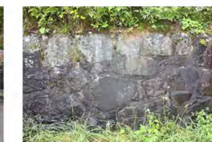
STØTTEMUR NR. 21