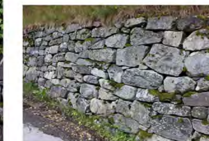
STØTTEMUR NR. 15