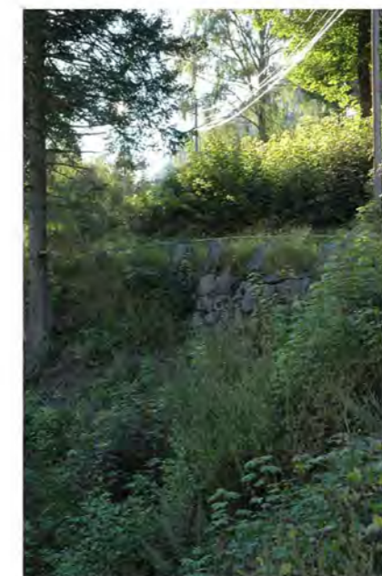
STØTTEMUR NR. 17