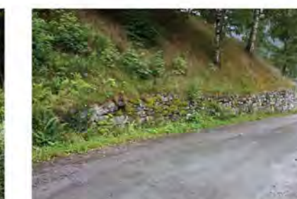
STØTTEMUR NR. 15