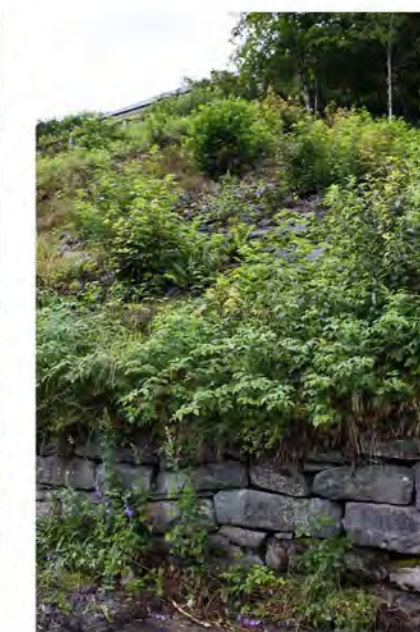
STØTTEMUR NR. 13 og 14