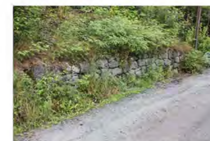
STØTTEMUR NR. 13

Støttemur lang innsiden av veistrekningen Villaveien, mot adkomstvei til Villaveien nr. 20 og 20A. Muren følger veistrekningen langs et parti på ca. 30 meter. Høyden varierer fra 0,5 meter til 1,6 meter over veidekket. Materiale: Naturstein. Naturlige blokker i ulik størrelse. Utførelse: Blokkene er murt i forbandt og har mørtel i fugene. Det er usikkert om muren opprinnelig hadde mørtel i fugene eller om disse er påført utenpå, i senere tid.