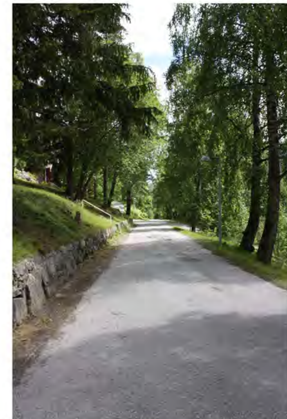
VILLAVEIEN MOT ØST