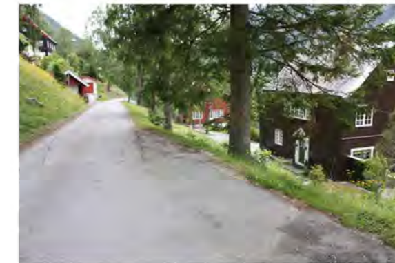
FJELLVEIEN MOT ØST