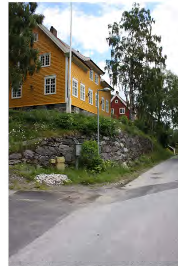
FJELLVEIEN NR. 6, MOT ØST

Bro over Kråssåi danner veiforbindelsen og har dekke og rekkverk av tre.