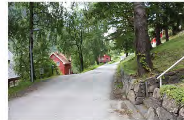
VILLAVEIEN MOT VEST