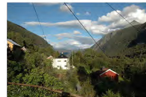
FOSSOVEIEN NR. 2A OG 4, MOT ØST