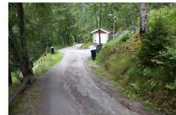
ADKOMSTVEI TIL FJELLVEIEN NR. 2A