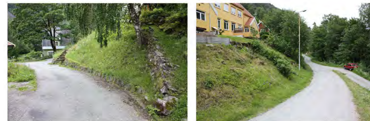
ADKOMSTVEI TIL VILLAVEIEN NR. 24 OG 26