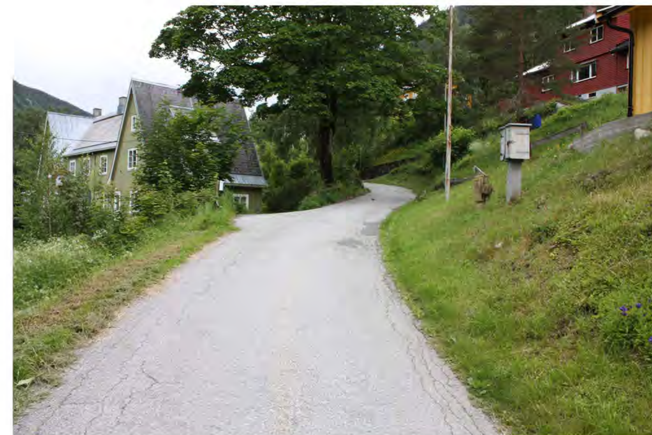
VILLAVEIEN MOT VEST

Trappeløpet er svært tilgrodd og ikke i bruk.