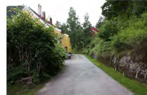
ADKOMSTVEI TIL VILLAVEIEN NR. 24 OG 26. MOT VEST