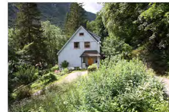
BØHAGENLIA NR. 15. MOT VEST