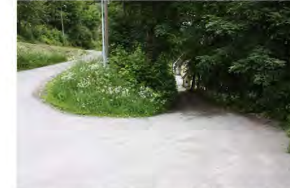
INNKJØRING TIL BØHAGENLIA FRA VILLAVEIEN. MOT ØST