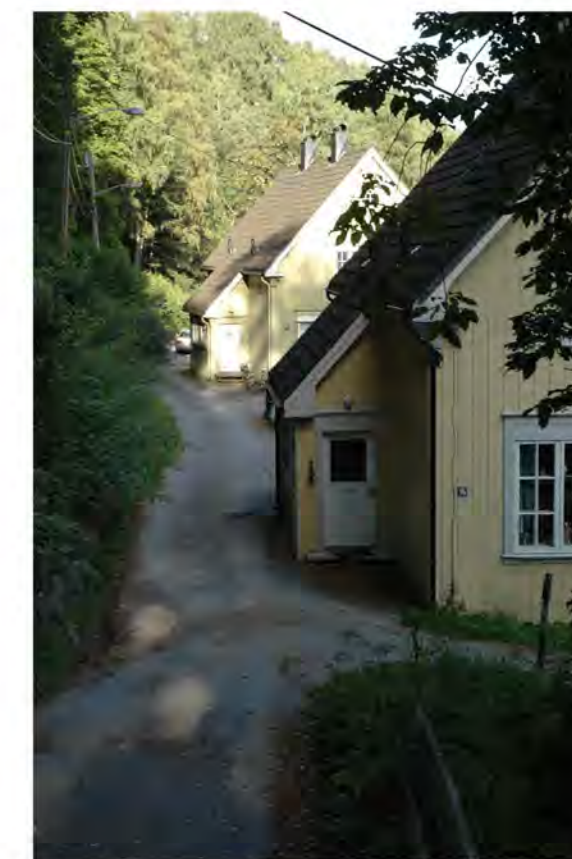
BØHAGENLIA NR. 16 OG 18. MOT ØST