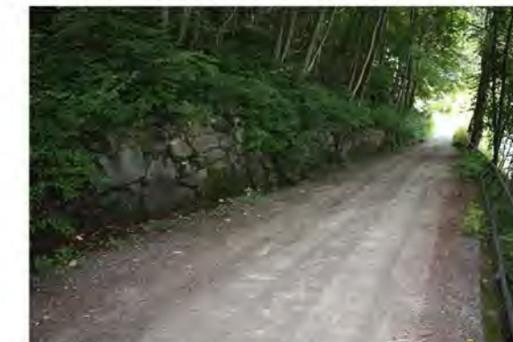
VEIFORBINDELSEN MELLOM VILLAVEIEN OG FLEKKEBYEN