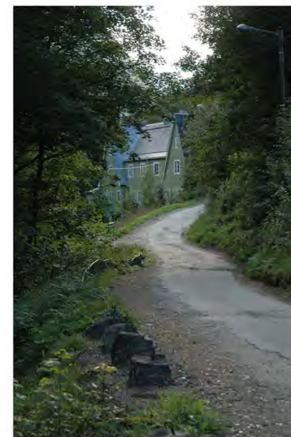
VILLAVEIEN MOT VEST

Veiforbindelsen mellom Flekkebyen og Villaveien fungerer som adkomstvei til bebyggelsen i Bøhagenlia nr. 15,16,18 og 20. Forbindelsen skaper en kommunikasjon mellom boligområdene og for fotgjengere er dette en snarvei fra Villaveien til dalbunn. For bilister er strekningen smal og avgrenset av støttemur og gjerde langs kantene. Veidekket består av grus og mange steder har nedbør dannet ujevnheter og utglidninger i dekket. Strekningen er utfordrende og er lite benyttet av andre enn beboerne i Bøhagenlia. Vinterstid er dette en svært utfordrende strekning.