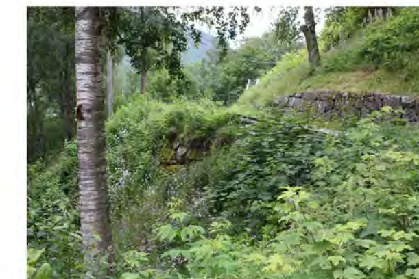
VILLAVEIEN MOT VEST FORTETTING LANGS STØTTEMUR