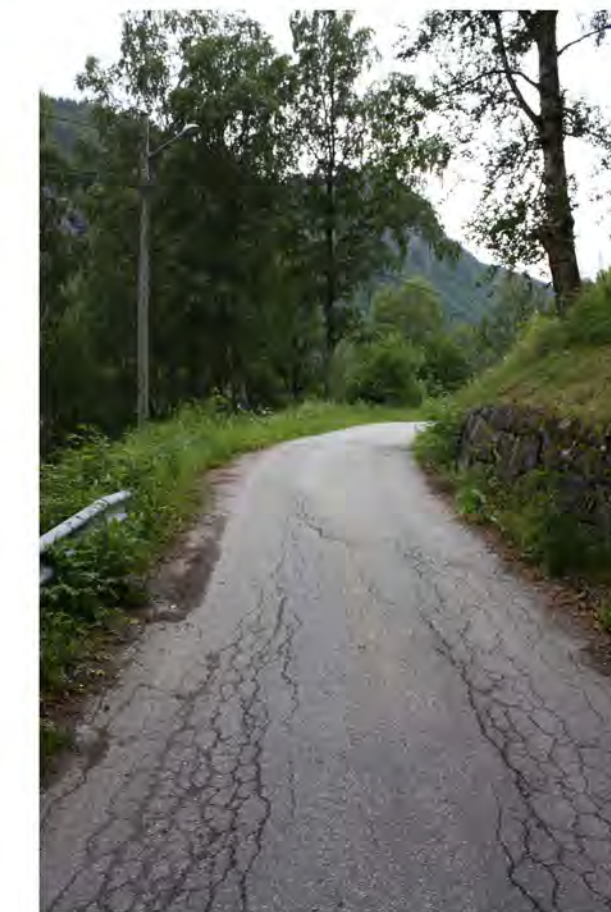
VILLAVEIEN MOT VEST