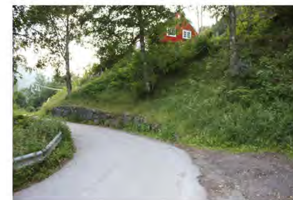
VILLAVEIEN MOT VEST PASSERINGSLOMME