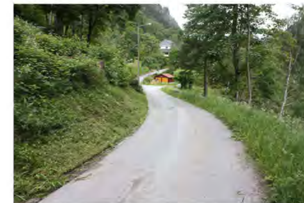
VILLAVEIEN MOT ØST