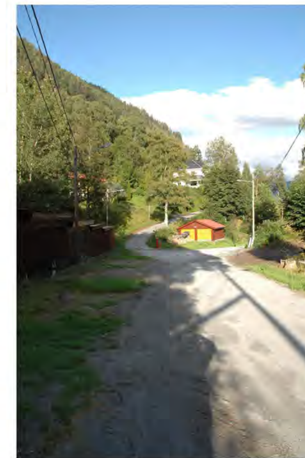
VILLAVEIEN MOT ØST ADKOMSTVEI TIL DIREKTØRBOLIGEN