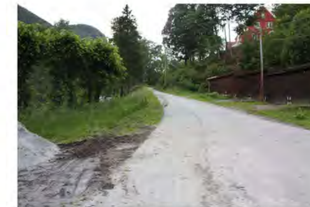
VILLAVEIEN MOT VEST PRIVATBOLIG NR. 16 TIL HØYRE