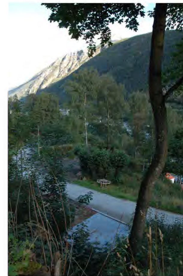
UTSIKT MOT JA-PARKEN FRA ADKOMSTVEI TIL BOLIG NR. 16 OG NR. 18

Adkomstveien til bolig nr. 16 og 18 har et autoverm av galvanisert stålprofil.