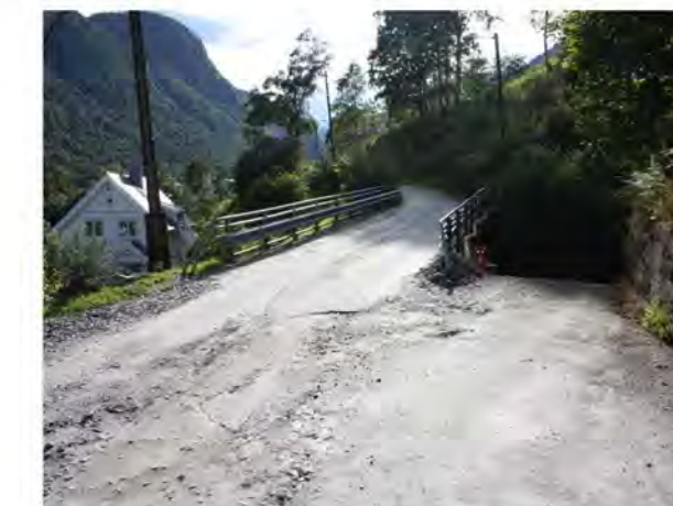
AVKJØRSEL TIL VILLAVEIEN NR. 15