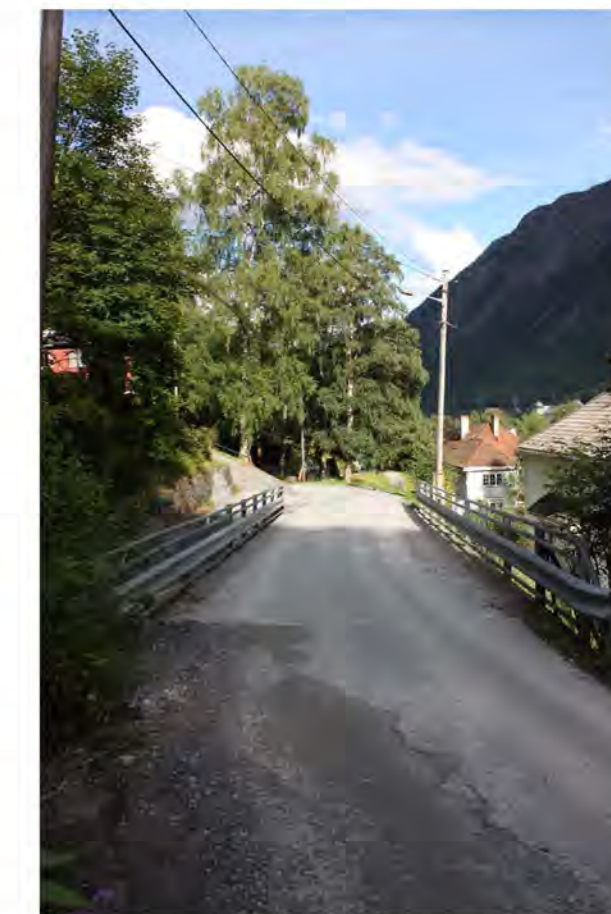
VILLAVEIEN MOT ØST