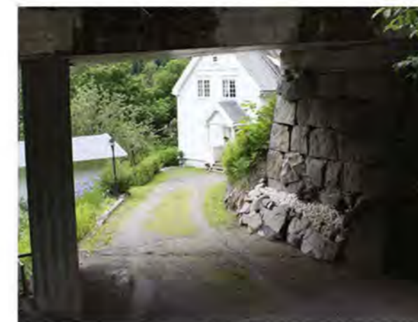
ADKOMSTVEI TIL VILLAVEIEN NR. 15