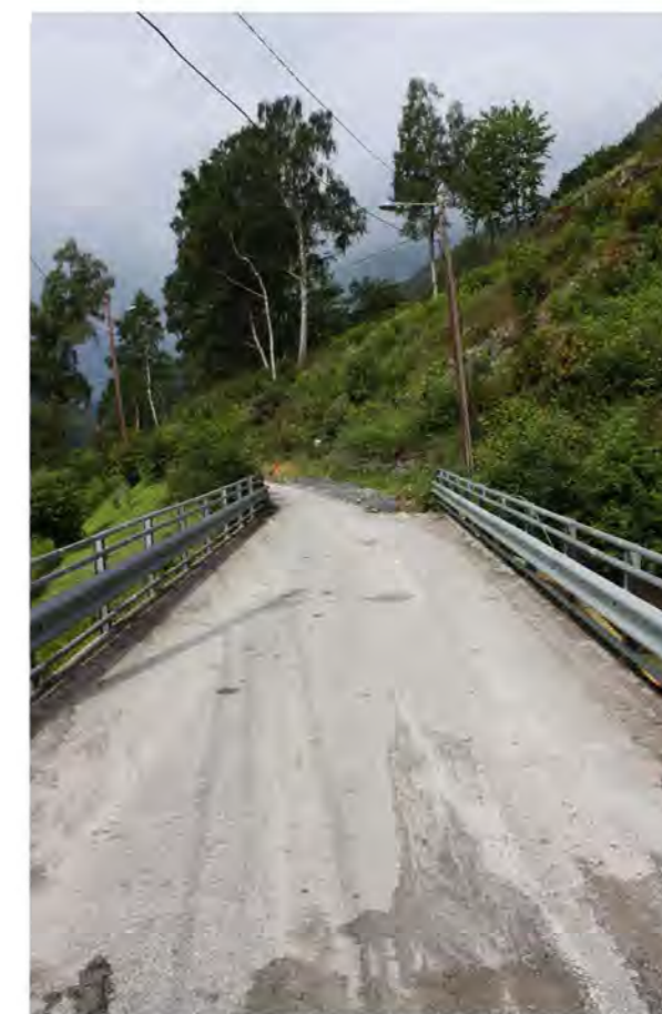
VILLAVEIEN MOT VEST

I landskapet har terrenget en naturlig dalform langs snittet. I bunnen av dalformen ligger det et bekkeløp som møter adkomstveien og ledes ned i en sjakt av betong og stål.