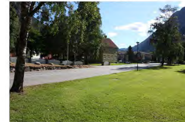
SAM EYDES GATE OG RALLARPARKEN MOT ØST