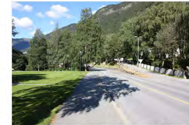
SAM EYDES GATE OG INNKJØRING TIL SØLVOLDVEIEN MOT VEST