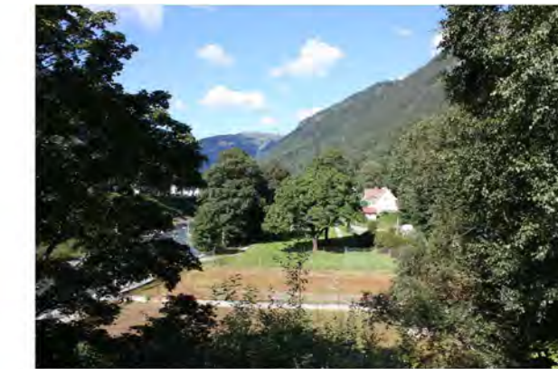
BRÅVOLDPARKEN OG TENNISBANEN MOT VEST