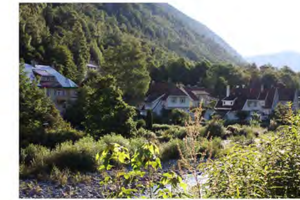
BRÅVOLD MOT ØST